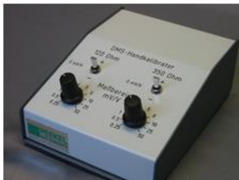
Abb. DMS-Kalibrator mit zwei Brückenwiderständen