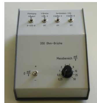
Abb. DMS-Kalibrator mit der Option DMS \frac{1}{2} - und \frac{1}{4} -Brücke